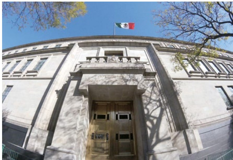
Este archivo está bajo la licencia Creative Commons Attribution-Share Alike 4.0 International.

Por su parte, el Poder Judicial es el encargado de vigilar que se cumpla la ley. En México, esta función se deposita en la Suprema Corte de Justicia de la Nación, en un Tribunal Unitarios de Circuito, Juzgados de Distritos y en el Consejo de la Judicatura Federal. Estos cargos no son de elección