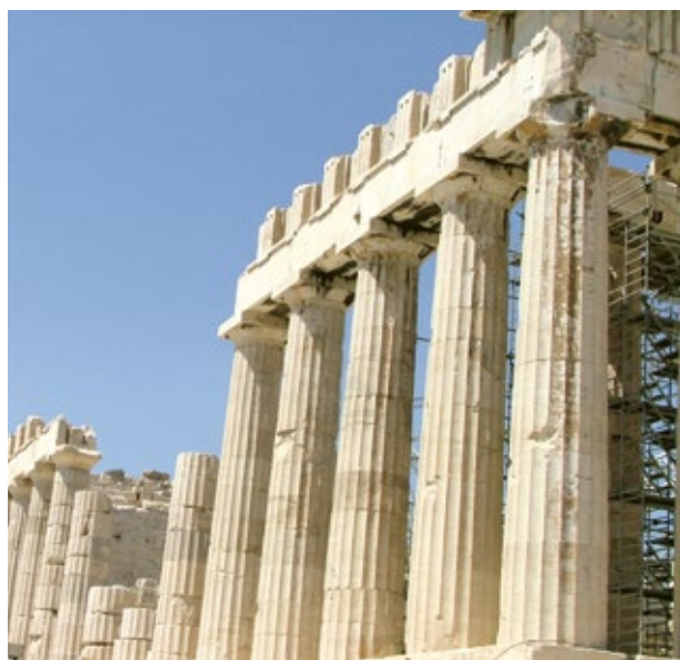
Dorieo. (2007). El Partenón .

Hace más de dos mil años, en la antigua Grecia, donde se originó la democracia como forma de gobierno, todos los ciudadanos se conocían y dialogaban para intervenir en las decisiones. A eso se le llama democracia directa, cuando todos se reúnen y juntos deciden lo que hay que hacer.